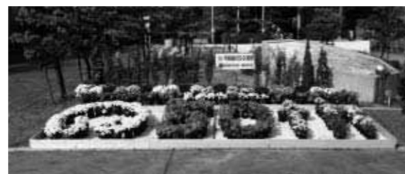
▲町制施行50周年を記念する花文字