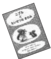
● ニブルとたいせつなきのみ ジーン・ジョン文 (ピレックス出版)