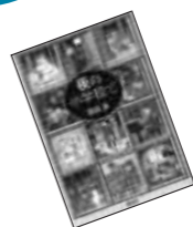
● 夜の小学校で 岡田 淳 作 (偕成社)