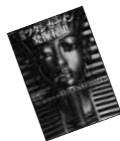
● 図説ツタンカーメン 発掘秘史 レナード・コッレル 著 (原書房)