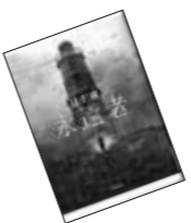
● 永遠者 辻仁成 著 (文芸春秋)