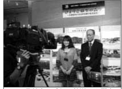
▲11月前半に番組で放送した郷土資料館特別展は、12月2日まで開催しています

BAN-BANテレビ行政広報番組 東播磨ふれあいネット BAN-BANテレビ111チャンネル 放送時間 月曜日 14:00～、22:00～ 火曜日 9:00～、16:00～、遅0:00～ 水曜日 11:00～、18:00～ 木曜日 13:00～、20:00～ 金曜日 15:00～、22:00～ 土曜日 17:00～、遅0:00～ 日曜日 10:00～、19:00～