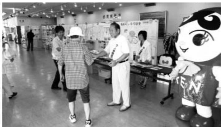
▲啓発活動に参加する「人権あゆみちゃん」

②8月に「共に生きよう ふれあいのまちはりま」映画会、12月に「こころふれあう 町民のつどい」講演会で啓発物を配布すると共に、「人権あゆみちゃん」の出演を実施しています ③播磨町の幼稚園、保育園で、ペープサート・紙芝居を実施しています ▼問合せ 人権擁護委員については、福祉グループにお問合せください 福祉グループ ☎079 (435) 2362