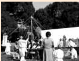
▲火起こしの儀を見守るヒメミコさま

今年、土山駅から「ムラ首長によるヒメミコへの献上品を届ける行列」が新たに加わります。その行列で着る古代衣装を大中遺跡公園の草木で染めるプロジェクトを立ち上げましたので参加者を募集します。 ▶日時 10月13日(土) ①9:00～12:00 ②13:00～16:00 ▶場所 郷土資料館 学習室 ▶対象(作業内容) 葉っぱなどで楽しく衣装を染めてくれる人。親子での参加も歓迎です ※衣装作りプロジェクト参加者は、古代衣装を着て大中遺跡まつり当日の行列に参加をすることもできます。 ▶参加費 無料 ▶定員 各15人 計30人 ▶申込み・問合せ 郷土資料館 ☎079(435)5000