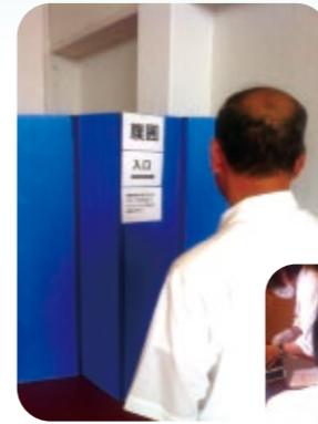
▲中央公民館での健診の様子▶