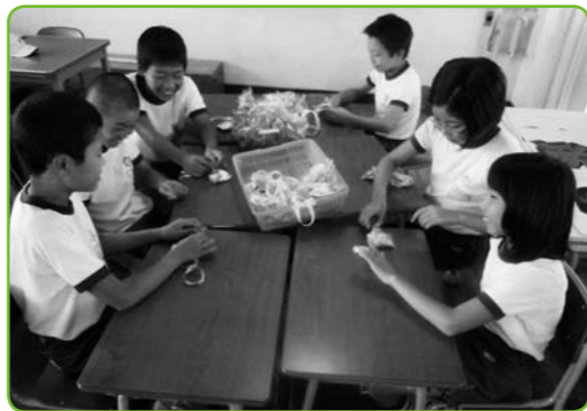
▲「幼稚園の子、喜んでくれるかな」