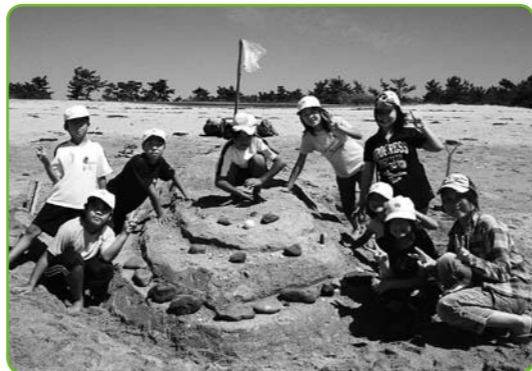
▲砂の造形「いざ！出航！！」