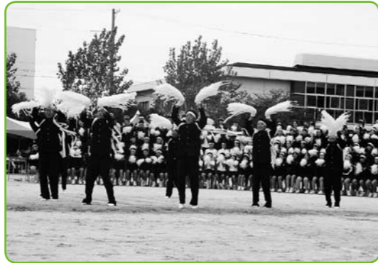
▲活気あふれる応援合戦