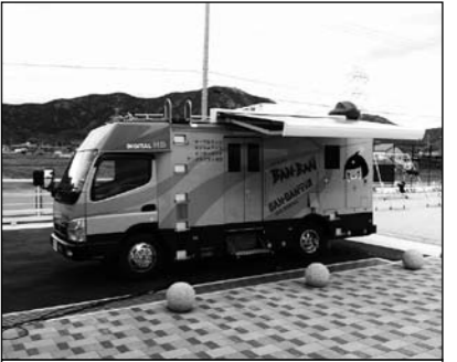
▲この中継車で番組を収録します