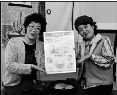
▲「もうつけましたか? 住宅用火災警報器」(5月1日~15日放送)