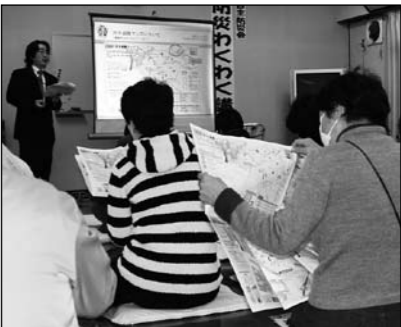
▲防災についてお伝えします