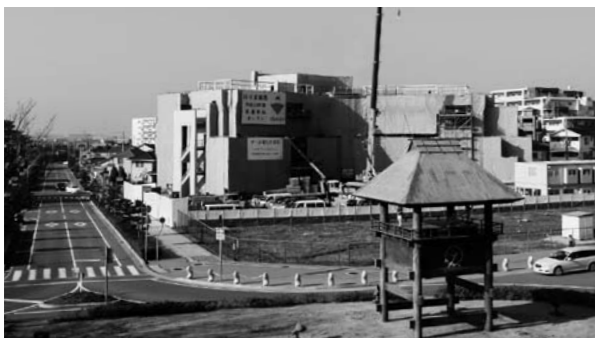
▲工事がすすみ、外観が見えはじめたはりま病院