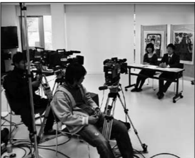
▲地域連携交流施設で収録しました