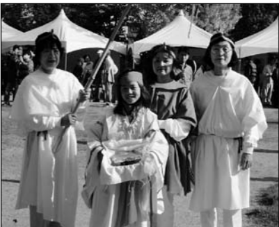
▲10月18日(月)~31日(日) 大中遺跡まつり特集を放送

東播磨ふれあいネット BAN-BANテレビ11チャンネル 播磨町・稲美町・加古川市・高砂市からの情報をわかりやすくお届けする行政広報番組です。