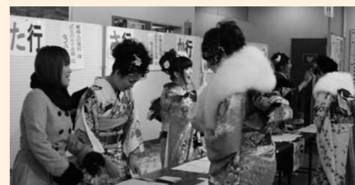
▲平成22年成人式の受付の様子