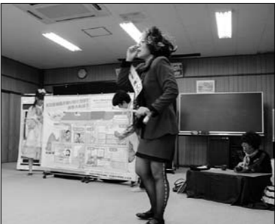
▲9月20日(祝)～10月3日(日) 女性分団特集を放送します