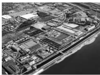
▲加古川下流浄化センター

9月10日は下水道の日です。普段は地面の下にあって目立たない下水道ですが、快適な生活や自然環境の保護に大きな役割を果たしているのです。