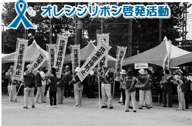
▲地域ぐるみで子どもを虐待から守る意識づくりを広げる運動(ひょうごオレンジネット推進事業)で、啓発活動を行う民生委員児童委員(7月31日夏まつり会場にて)

播磨町では、子育て支援の観点から、安全基準を満たした幼児2人同乗用自転車の利用を促進するために、同自転車のレンタル事業を行います。 ▼申込み・問合せ 福祉グループ 079(435)2362 ▼利用期間 1年間(更新可) ▼レンタル期間 10月1日～平成23年9月30日 ▼募集人員 20人 ▼利用料金 無料 ▼条件 ・同乗する幼児はヘルメットの着用が必要 ・事故などで発生した損害にかかる賠償は利用者負担で利用者責任(傷害保険は利用者負担) ・自転車の返却または利用期間の更新に際しては、利用者負担による点検整備を行う ・自転車の盗難などの弁償にかかる費用は、利用者負担 ▼申込み・問合せ 申請書は、福祉グループに提出するか、郵送してください。 ▼申込期間 8月16日(月)～9月3日(金) ※交通安全講習を受講することや啓発事業への協力をしていただきます。