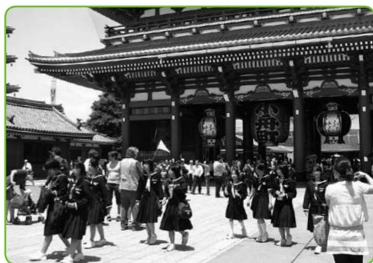
▲浅草散策するぞお〜