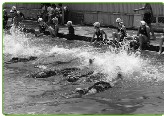
▲目標に向かって頑張ります