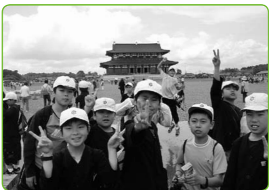
▲奈良・伊勢方面へ行ってきました