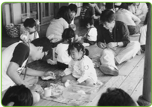
▲力を合わせて作ります