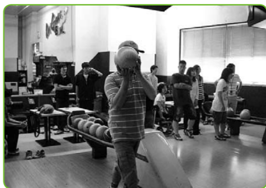
▲クラス活動でボウリングをしました