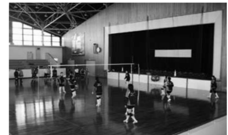
▲利用者でにぎわう総合体育館