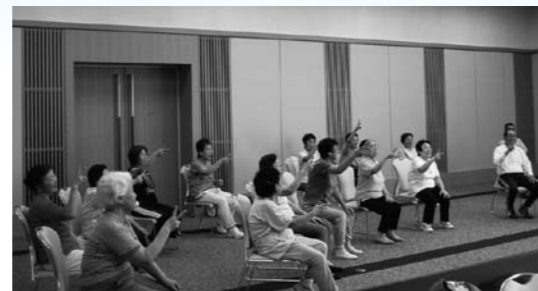
▲いすを使つての運動