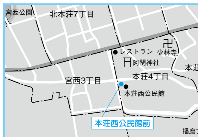
⑦本荘西公民館 4月17日(金) 午後1時50分～2時10分

狂犬病予防注射と 飼い犬の登録をしましょう ▼問い合わせ 健康安全グループ ☎079(435)2721 狂犬病予防法で、犬の飼い主には、犬の登録（生後91日以上の犬）と狂犬病の予防注射を毎年1回受けさせることが、義務付けられています。 平成21年度の狂犬病予防注射と犬の登録について 表1の日程で、狂犬病予防注射の集合注射を実施します。登録が済んでいない犬は、注射と登録を同時に行います。都合の良い場所、時間にお越しください。 また、表2の動物病院でも、年間を通じて、注射と登録を行っています。費用も集合注射と同額です。 なお、すでに播磨町で登録されている犬については、狂犬病予防注射通知書を3月中旬に発送しています。 ▼持参するもの・費用 ・登録した犬 ・狂犬病予防注射通知書 ・費用 1匹につき3千200円 ・登録していない犬 ・費用 1匹につき6千200円