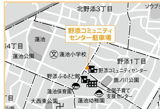
③野添コミセン 4月16日(木) 午後2時～2時20分

集合注射では、多くの犬が集まるため興奮し、犬同士の喧嘩になる場合がありますので、注意してください。 犬も人と同じ生き物です。毎日体調は変わっていきます。注射による事故を防止するためにも、十分な説明を受けて、同意した上で注射を受けるようにしましょう。 動物病院では、日常の健康管理なども含め、予防注射以外のアドバイスもいたします。集合注射以外での注射を希望される方は、動物病院に直接お越しください。 ▼問い合わせ 表2の各動物病院