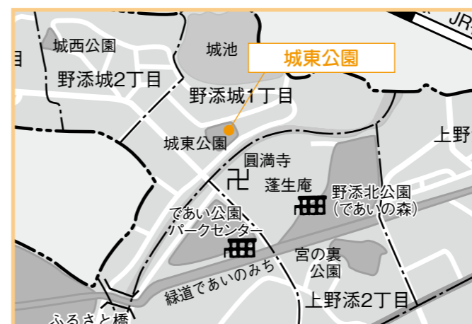
④城東公園 4月16日(木) 午後2時30分～2時40分