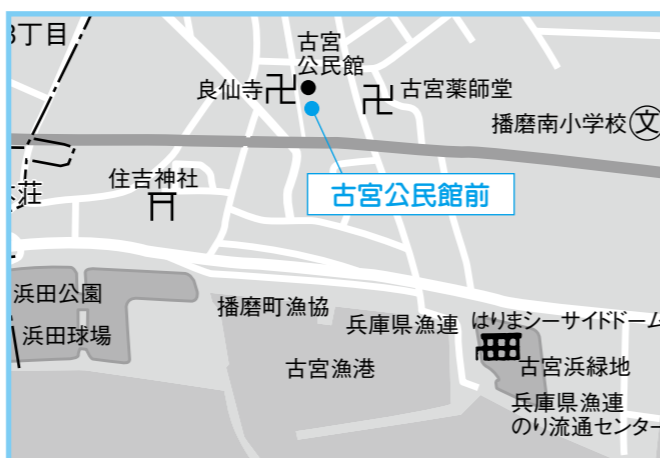
⑥古宮公民館 4月17日(金) 午後1時25分～1時40分