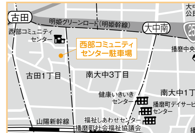
①西部コミセン 4月16日(木) 午後1時10分～1時25分