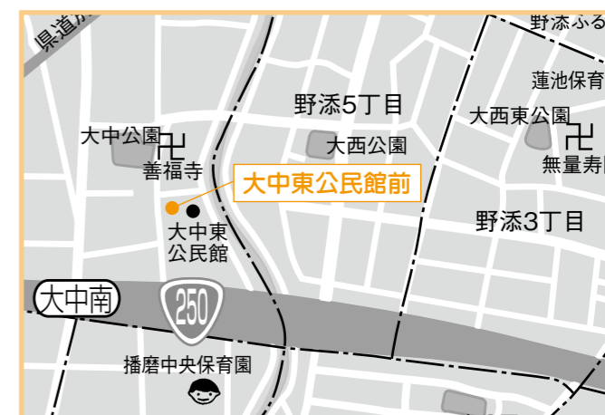
②大中東公民館 4月16日(木) 午後1時35分～1時50分