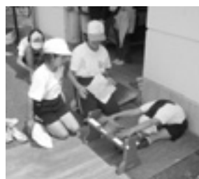
長座体前屈の平均値 (単位 cm)