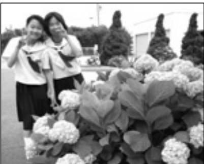
▲写っている方に画像データを差しあげます。企画グループへお電話を。