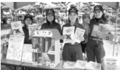
▲住宅用火災警報器をPRする播磨町女性消防団の皆さん