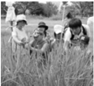
▲秋の実りが楽しみです