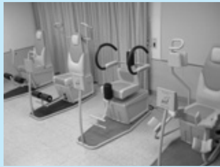
▲低体力者用のトレーニングマシン4台