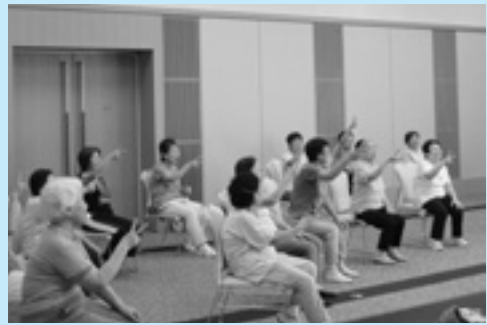
▲いすを使っでの運動

▼定員 先着20人 ▼申し込み 6月28日(土)までに参加費を添えて健康いきいきセンターまでお申し込みください