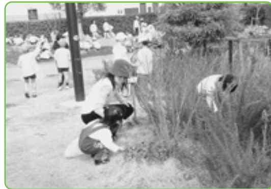
▲お母さんと一緒に草ひき。みんなできれいにして、みんなで遊ぶね