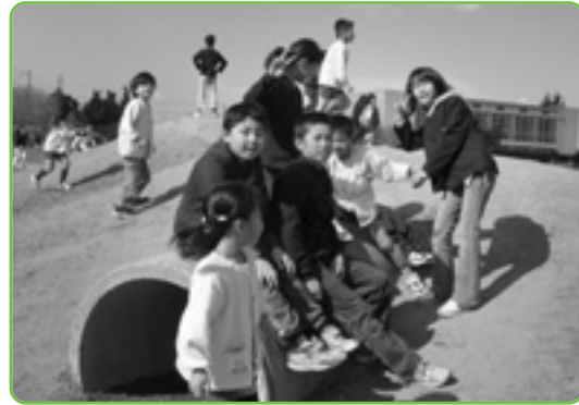
▲新1年生と交流会。外は寒かったけど、楽しかったね