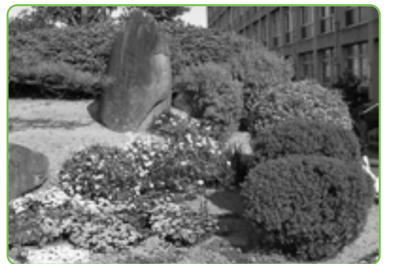
▲1年間ありがとうございました。次号からは新しい生徒会が執筆します