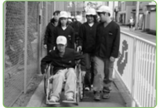
▲車椅子に乗ってみたいと分からないことが、たくさんありました