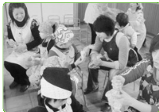
▲“くちゃくちゃ”つぶして、…おいしくなれ!