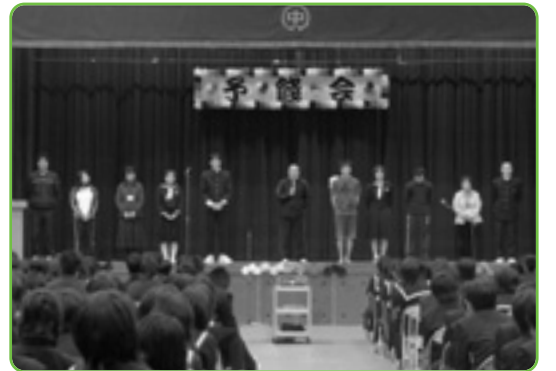
▲後輩たちが気持ちを込めて飾ってくれた体育館で、当会が行われました