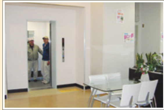
▲中央公民館に設置されたエレベーター

■3月議会において、平成20年度予算が審議され、今年度の主要事業4件(中学校給食、コミュニティバス、窓口案内、土山駅南開発)を削除するという修正案が9対8で可決されました。多くの住民の方々からご期待をいただき、上程に至るまでに多くの関係機関や住民の方々に関わっていただき調査・検討を重ねた事業でありましたので、またしても1票差で、住民生活に関係したこれらの事業に取り掛かれないうことは、とても残念な思いがしています。