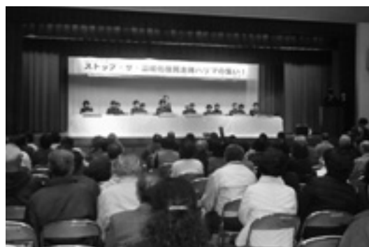
▲野添花の皆さんの大正琴によるオープニングコンサート

平成20年2月16日(土)にゆめづくり塾主催で環境フォーラム「ストップ・ザ・温暖化住民主体ハリマの集い!」を開催しました。