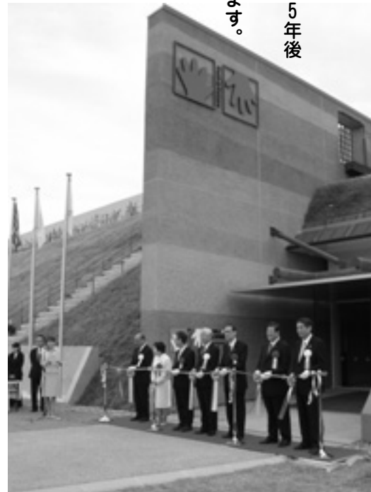
▲連日多くの来館者が訪れる博物館

9月 大中遺跡公園駐車場と大中遺跡公園の整備が完了 狐狸ヶ池に駐車場と公園を結ぶボードウォーク(遊歩道)が設置されました 10月 町制施行45周年記念式典挙行 町の歴史を振り返るとともに、その発展に貢献された方々を表彰する記念式典を執り行いました 11月 大中遺跡まつり 開催 県立考古博物館と協同して全国遺跡まつりを同日開催し、例年を上回る来場者でにぎわいました 12月 町定例会をインターネットで中継 各定例会及び臨時会をインターネットを使って生中継と録画映像にて公開しました。また、役場第1庁舎1階ロビーに設置した大型テレビでも生中継を9月定例会から公開しています