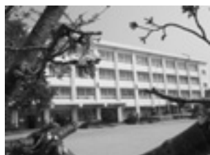
▲北小校庭の桜 (閉校式の日に撮影)

3月 播磨北小学校 閉校 昭和56年の開校から26年間で、約1720人の児童がこの校舎で学びました