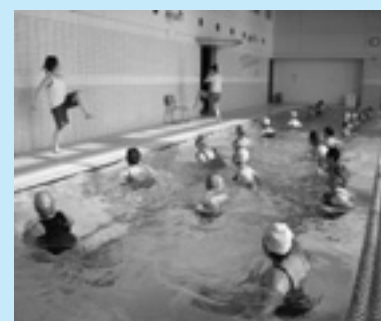
▲プール (アクアビクス)