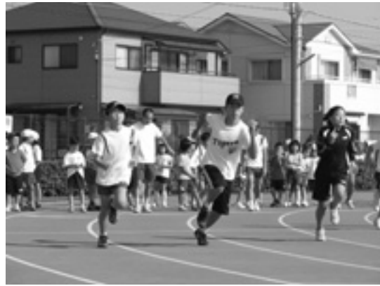
▲力強く走る子どもたち(秋ヶ池運動場)

新年あけましておめでとうございます。皆さま方には、健やかに初春をお迎えのことと、心からお喜び申し上げます。