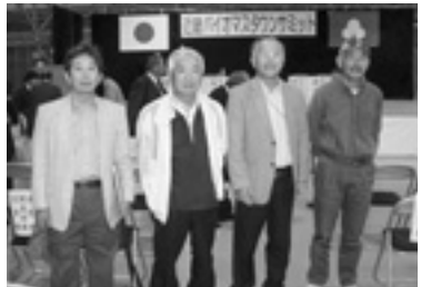
▲近畿バイオマスタウンサミット会場にて

私たちの播磨町においても緊急に取り組まねばならない地球温暖化防止に、廃棄物から有効資源を生み出す新技術の応用で温暖化防止に貢献できる取り組みが求められています。