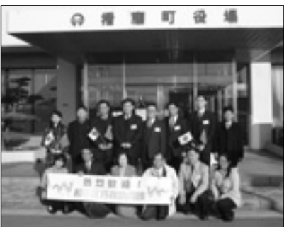
▲写っている方に画像データを差しあげます。企画グループへお電話を。