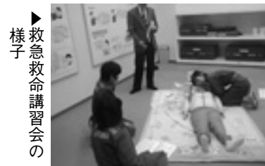
▶救急救命講習会の様子

5月13日(日)には、男性消防団員と一緒に望海公園で行う、ポンプ操法講習会にも参加しました。