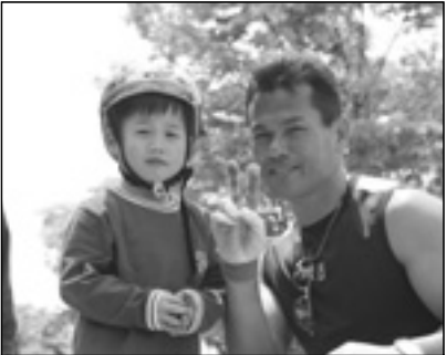
▲写っている方に画像データを差しあげます。企画グループへお電話を。