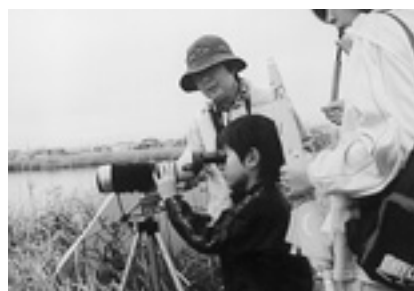
▲観察地域 向ヶ池→喜瀬川→城池(徒歩で移動し、城池で現地解散)