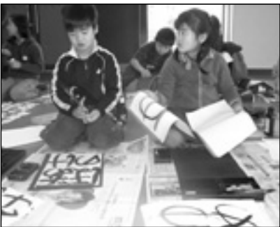
▲写っている方に画像データを差しあげます。企画グループまで。