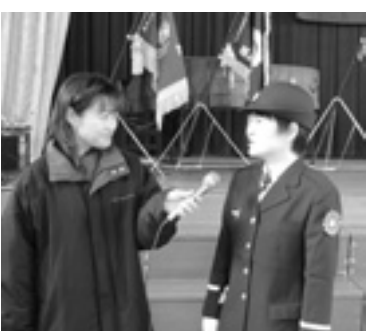
▲元気にインタビュー

※詳しくは、総務グループで配布している案内をご覧ください。 ケーブルテレビ行政情報番組のリポーター募集 BAN・BANテレビ11チャンネルで放送中の東播磨2市2町の行政情報番組「東播磨ふれあいネット」のリポーターを募集します。 ▼対象 18歳以上で明るく健康な人 ▼申し込み・問い合わせ 2月28日(水)(必着)までに写真付きの履歴書をお送りください。 〒675-0039 粟津26-2 BAN・BANテレビ「東播磨ふれあいネット」リポーター募集係 ☎079(421)3736 ※応募された書類は返却できません。