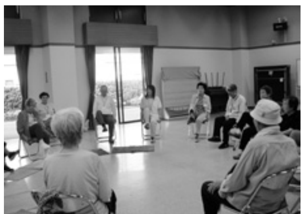
▲通所を続けて生活にリズムができます

楽々くらぶ （通所介護予防事業） 「楽々くらぶ」は、作業療法士、理学療法士、栄養士、歯科衛生士による専門的な指導と、介護スタッフの見守りによる介護予防に取り組んでいます。 ▼内容 軽い運動や食事と栄養のお話、歯の話など ▼開催日・会場 月4回。福祉会館、野添コミセン、南部コミセン、西部コミセンで開催。 ※自己負担がありません。 ※必要な方には送迎をします。