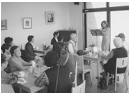
▲穏やかなフルートの音色

町内の福祉施設・いきいきサロン・老人会などを訪問し、マジック、楽器演奏、落語、漫才、歌、踊りなど日ごろの練習の成果を披露し、障害者や高齢者の方々に楽しんでいただくボランティア活動をしてくれる方を募集します。