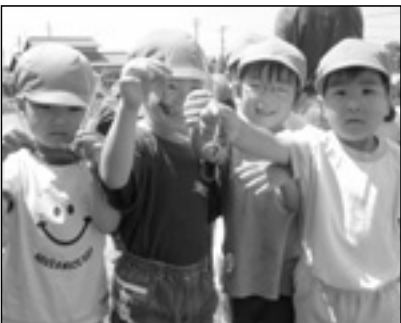
▲写っている方に写真または画像データを差しあげます。企画調整課まで。