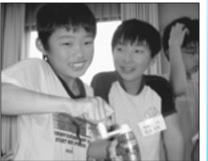
▲写っている方に写真または画像データを差しあげます。企画調整課まで。