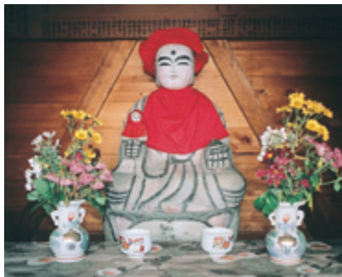
▲いつまでも美しく

町内にもお地蔵さんは数多くありますが、中でも人目を引く二子のこのお地蔵さんは、女性のお地蔵さんということで化粧をしています。手のひらに乗せているのは小さなお地蔵さんで、赤ちゃんを表しており、お参りをする子どもを授かると言われていました。