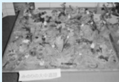
▲みんなで作った古代の村