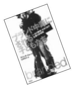
●ブランド中毒にされる子どもたち アリッサ・クオート作・古草 秀子訳