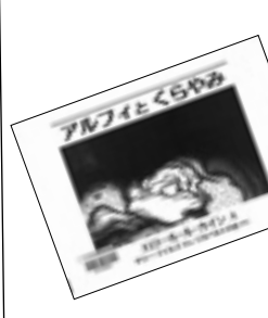
●アルフィとくらやみ サリー・マイルズ文・ジルベルトの会訳