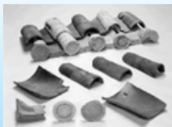
▲久留美遺跡(三木市)出土瓦

▶期間 2月19日(土)～3月21日(祝) ▶場所 郷土資料館 [月曜日と2月27日(日)は休館]