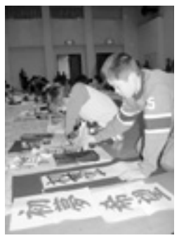
▲お正月早々真剣に書に向かう児童の皆さん。