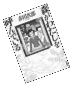
●森がわたしを呼んでいる 赤川 次郎