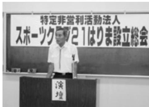
▲2月23日NPO法人設立総会を開催しました

「スポーツクラブ21はりま」はかねてよりNPO法人の申請をしていましたが、平成16年11月29日に兵庫県より認定許可が出ました。今後は「NPO法人スポーツクラブ21はりま」としてスタートします。