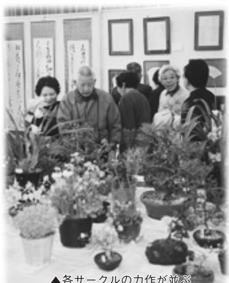
▲各サークルの力作が並ぶ