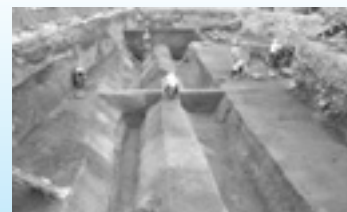
▲邸宅の二重堀(神戸市兵庫区)