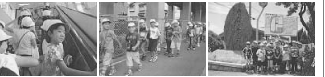
▲たくさんの発見をしました

くりした土山駅コース。「いっぱい歩いてつかれたけど、そのぶんいっぱい楽しめた探検だったよ」「はりま町にも、くふうしたところいろいろあることがわかったよ」など、播磨町の良さを再発見した1日でした。