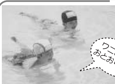
ワニさんのおとおいだ!

「今日も大きいプール!」「お水いっぱいやで」と学校のプールを楽しみにしている子供たち。さっそくプールに入ると、「アヒル歩き」「フニ歩き」が始まります。そのうち「顔がつけられた!」「もくれた!」と、あちこちで嬉しいうちが飛び出しました。プカプカ浮き輪の舟や汽車、子供たちは、友達と元氣いっぱい思いきりの笑顔で遊びます。「ああおもしろかった!」みんな満足顔です。