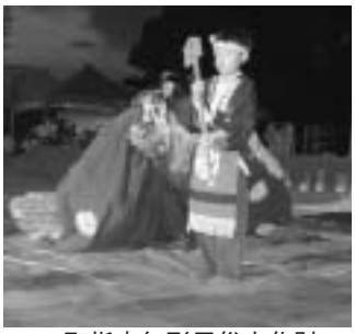
▲町指定無形民俗文化財