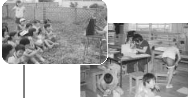
▲あなたならどのサークル活動？

『すてきな南小、自慢できる南小』をほめた手、私たちの手で、『合言葉に、サークル活動を立ち上げるのは6年生の役割。どんな活動をするかを考え、高学年集会で4・5年生に説明し、勧誘。賛同した子供たちが加わり、今年もサークル活動が開始。今年、次の12のサークルが成立しました。