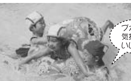
プカプカ気持ちがいいな!

「今日も大きいプール!」「お水いっぱいやで」と学校のプールを楽しみにしている子供たち。さっそくプールに入ると、「アヒル歩き」「フニ歩き」が始まります。そのうち「顔がつけられた!」「もくれた!」と、あちこちで嬉しいうちが飛び出しました。プカプカ浮き輪の舟や汽車、子供たちは、友達と元氣いっぱい思いきりの笑顔で遊びます。「ああおもしろかった!」みんな満足顔です。