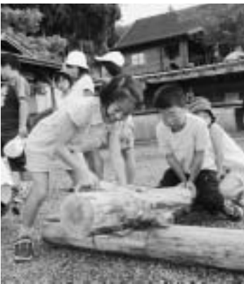
▲「もうすこし、がんばれ！」

8月6日(金)、7日(土)の1泊2日の日程で、播磨町から20人の子供たちが朝来町を訪れ、朝来町の27人の子供たちと交流を行いました。 初日は、朝来町で、川遊びと川の生き物観察にチャレンジ、飯ごう炊きやキャンプファイヤーも楽しみました。 2日目は、丸太切り競争に挑戦した後、朝来町の子供たちを播磨町に招待し、一緒に工作をしたり、大中遺跡まつりに参加して、親睦を深めました。