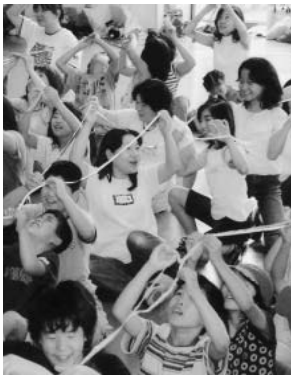
▲遊びリーダーの親子研修会

先の青少年問題協議会では、青少年を健やかに育成する方策について、各団体の活動や考え方を話し合いました。住民一人一人が子どもたちに温かい目を向け、あいつつなど声をかけることで、安心して暮らせる町になります。各団体では「親子・ファミリーで地域活動に参加しよう」「あいつつ運動をしよ」と確認しました。