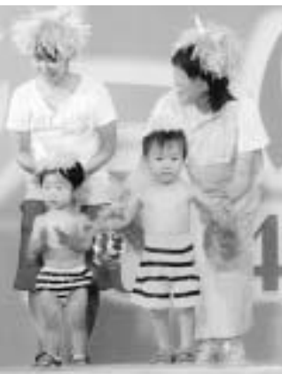
▲かわいいカミナリさま