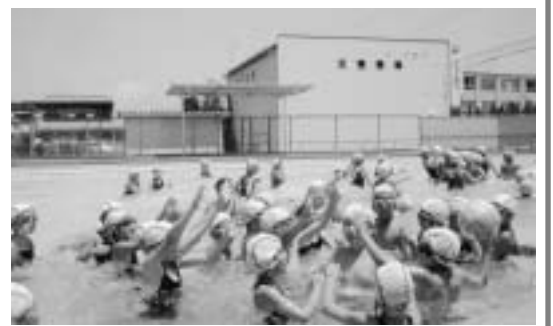
▲こっちに投げてー！

「うわっ、冷たいけどめっちゃ気持ちいいな」プールに入った子供たちの第一声です。台風による警報のため、予定より1日遅れの6月22日(火)にプール開きがありました。波乱の幕開けとなった今年のプールですが、それ以後は晴天に恵まれ、絶好の水泳日和が続くことになりました。子供たちは、元気がいっぱいになり、水を泳ぎを上げ、水遊びや水泳の練習を楽しみました。7月に入ると気温もぐんぐん上がり、それにつれて水温が27〜28度にもなり、まるで温水プール状態です。子供たちは、「温泉みたいだな」「なんてぜいたくな？」「ことを言いながら、一生懸命、自分の目標に向かって練習に取り組みました。」