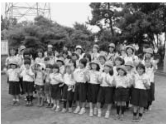
▲楽しいこといっぱい