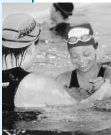
▲水曜日がまじどおしい

7月7日(水)から障害児水泳教室が、健康いきいきセンターで始まりまし。この教室では水中歩行、大小の輪を使って水の中に顔をつける練習、そして少しずつ泳ぐ練習をするというような内容が進められます。