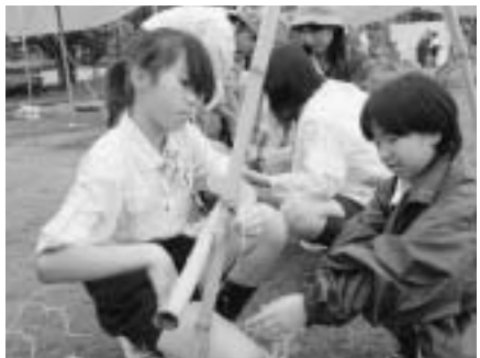
▲「こっちからこうするねんで」

スカウトの声「いろんなことを体験できるので楽しいです」「違う学校の子とたくさん友達ができました」「活動の中で、はスキーとキャンプが好きです」