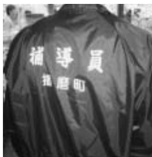
▲このユニフォームで活動中

A. 毎月4人ぐらいのグループで補導委員のロゴの入ったウインドブレーカーを着て、徒歩や自転車で播磨町の各所、特に青少年のたまり場、危険箇所を中心に回っています。少年の喫煙や夜遊びなど非行行為の防止に努めています。