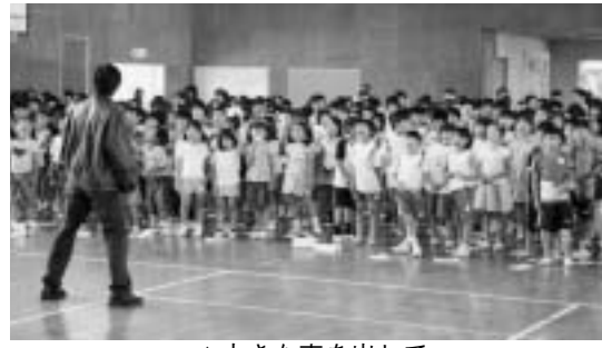
▲大きな声を出して

このワークショップは、11月25日(木)に本番が上演されるのにあたり、物語の説明、子供たちみんなが「おーいどこへ行って…」と舞台上に呼びかける時の指導、役者といっしょに歌う歌の指導、6年が舞台に出て演技する時の動き方の指導などが、1時間半ほどありました。