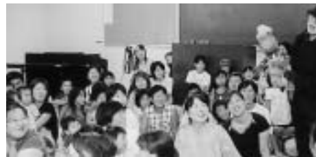
▼「うちしたのはだれ？」