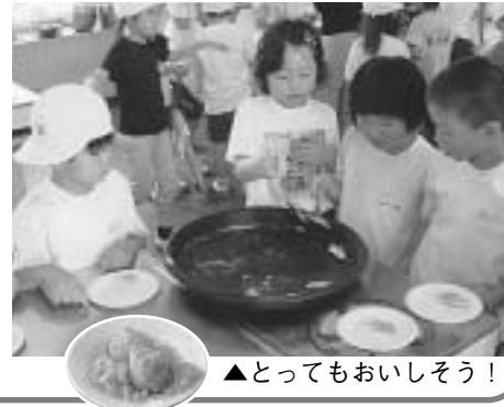
▲とってもおいしそう！

どんなことでも興味津々。何でもやってみよう！と、家で摘んできたタンポポやレンゲ、ハコベやヨモギ、学校内の桑の葉などを使い、天ぷらにして食べてみて、驚き大満足。作り方を調べ、校内で摘んだヨモギで作ったヨモギ餅のおいしさに、またまた大満足。