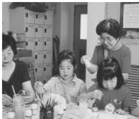
▲涼をよぶ風鈴づくりに挑戦

「近所のおばちゃん」に返ることが、必要になってきている。今、社会の第一線にいたいことを実感している。今後も、子どもたちが参加したくなる内容を考え、ふれあいを深めたい。