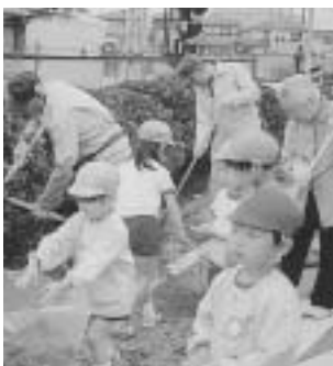
▲園の外を一緒に美しく

行事のたびにあいつつ運動を展開している。また、地域の人との交流を深めるふれあい行事に招待して交流している。