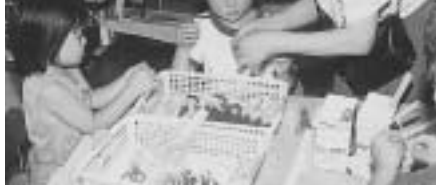
▲願いごとが叶いますように

今日は、老人クラブの人たちに親子で七夕飾りやこより作りを教わっていた日です。自分たちが作った短冊や飾りを見せて「これ、ほくが作ってん!!」「うまくできたね」とほめてもらってにっこりする幼児。「○○ちゃんが、早く元気になるように!」の願いごとを読んで「やさしいね」と喜んでくれるおばあちゃん。そんなほのぼのとした雰囲気の中、こより作りが始まりました。こよりがピンと立つと、「すこい!!」と大歓声。いざ自分たちが作り始めると…。お家の人も子供たちも「フニャフニャや!」「立たへん!!」と四苦八苦。自分たちが一生懸命作ったこよりで、笹に飾りを結びつけて大満足。この経験が、子供たちの心につまでも楽しい思い出として残ってもらいたいです。