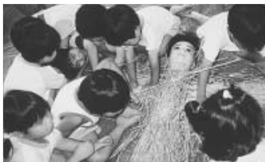
▲すてきな手足を作ってあげる

子供たちが田植えをして1カ月。苗も大きくなり、そろそろ案山子の出番です。今年は、老人クラブの方々が大人の案山子、園児が子供の案山子を作ることにしました。顔のついた棒を見て「体も手もない」「作ってあげないと」と大はしゃぎの子供たちは、わらで体の組み立てを始めました。初めてわらに触れる子もいて、「ちくちくして痛いね」「でも気持ちいいよ!」「どうやって体にするの?」と興味津々。また、「かかしはこんな形」と手を横に広げたり、足を上げてバランスをとる子もいました。今、どんな案山子にしようかな? と、各クラスで思案をしています。今年はどんな案山子が田んぼを見守ってくれるのでしょうか。楽しみです。