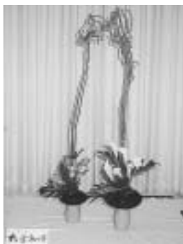
▲秋の花々が並びます