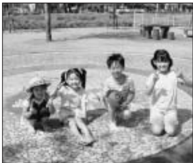
▲写っている方に写真または画像データを差しあげます。企画調整課まで。