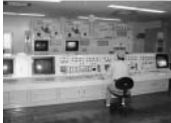
▲ごみ焼却施設操作室

昨年度は、播磨町全体で1万1千748トンのごみが排出され、これを処理するために4億1千万円もの費用がかかりました。この内容についての説明とごみ処理施設の見学会を開催します。 ▼日時 10月13日(水) 午前9時30分～11時30分 ▼場所 播磨町塵芥処理センター(新島) ▼内容 ①平成15年度のごみ処理費用や排出ごみ量などの説明 ②ごみ焼却施設、プラスチック容器類圧縮施設などの見学 ▼申し込み 10月8日(金)までに、電話またはEメールにて住所・氏名をご連絡ください。 播磨町塵芥処理センター ☎0794(35)25662 e-mail jinkai@prof.co.n.jp