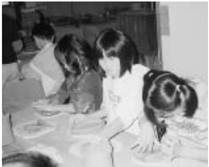
▲どんな作品ができるかな

楽しい夏休みの思い出に親子で陶芸作品を創作しませんか。世界でたった一つしかない、自分だけの作品づくりに挑戦しましょう。 ▼日時 8月2日(月) 午後1時～5時 ▼場所 中央公民館 実習室 ▼指導 陶芸教室役員 ▼募集人数 小学4年生～6年生の親子20組(保護者同伴でなくても可) ※定員になり次第締め切ります。 ▼材料費 500円 ▼持参する物 手ぬぐい・エプロン ▼申し込み 7月15日(木)までに中央公民館へ材料費を添え申し込みください。