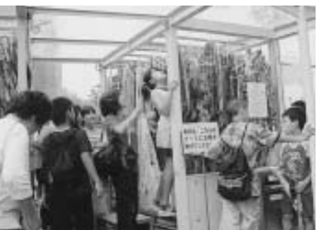
▲多くの人の祈りを込めた鶴