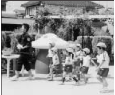
▲写っている方に写真または画像データを差しあげます。企画調整課まで。