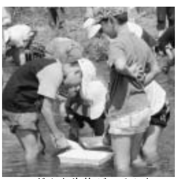
▲どんな生物がいるかな

▼日時 8月5日(木) 午前9時～午後5時 ▼内容 バスで加古川の下流と上流(加美町)に行き、水生生物の観察や水質の調査をします。 ▼対象 播磨町・加古川市・高砂市・稲美町の小学生とその保護者 ▼定員 200人(多数の場合は抽選) ▼参加費 無料 ▼持ちもの 弁当・水筒・帽子・ビーチサンダル・タオル・筆記用具 ▼申し込み・問い合わせ 往復はがきに住所、児童の名前、学年、同伴する保護者の氏名、電話番号を書いて7月13日(火)までに郵送してください。 〒675-18501 加古川市役