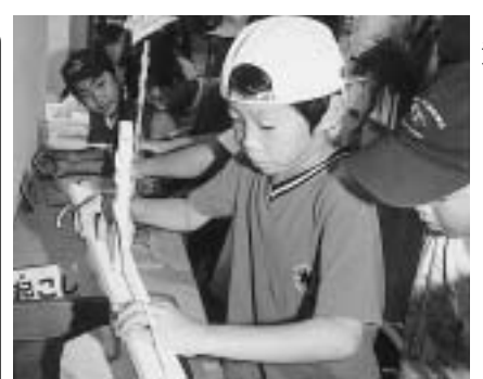
▲交流を深める子どもたち

播磨町が交流をしている朝来町の子どもたちと一緒に、ゲームやキャンプファイヤー、飯ごうすいさん、そして水辺の観察など様々な自然を体験し、新しいお友だちを作りませんか? 翌日には朝来町の子どもたちと大中遺跡まつりに参加し、さらに友情を深めます。 きつこの夏休みのすばらしい思い出になることでしょう。 ▼日時 8月6日(金)～7日(土)の1泊2日 ▼対象者 町内小学校3・4年生 ▼募集人数 20人。応募多数の場合は抽選を行い、7月16日(金)までに申込者に連絡します。 ▼参加費 1人2千円。参加者説明会の際に、納付していただきます。 ▼応募締め切り 7月12日(月)必着 ▼応募方法 はがきの裏に住所・氏名・電話番号・学校名・学年および保護者氏名を記入して郵送してください。 〒675-0182(この郵便番号を使用すれば、住所の記載は不要です) 播磨町役場企画調整課「チャレンジ教室」係 ☎0794(35)0356 FAX0794(35)06009