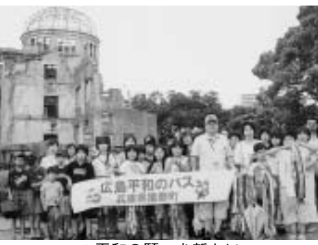
▲平和の願いを新たに

核兵器の怖さや戦争の悲惨さを認識し、平和の尊さ・平和を守ることの大切さを学ぶ機会を提供することを目的とした『広島平和のバス』を開催します。 平和記念資料館や原爆ドームなどの施設を見学し、被爆体験者から体験談を聞くとともに、原爆の子の像に千羽鶴をそなえます。