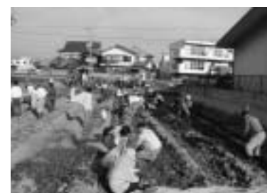
▲土の感触を楽しみながら