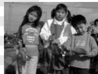
▲楽しく、おいしく、健康に