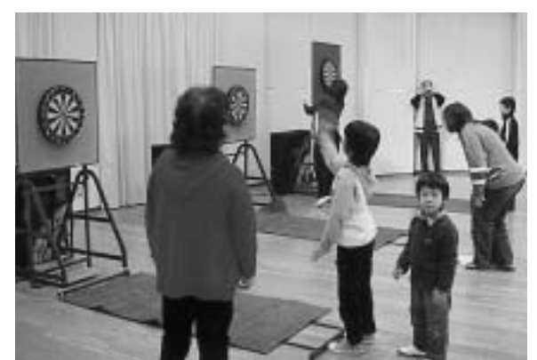
▲子どもも大人も楽しめるダーツ

◎今年も 播磨町健康福祉フェア 〔4月29日(祝)大中古代の村〕で、スポーツクラブ21はりまの各種サークル団体が日ごろの活動を紹介します。イベント参加者が体験できるコーナーも設置します。ぜひ挑戦してみてください!! ◎平成16年度の多種目 ふれあいスポーツ大会 と 初心者教室 を年間を通じ計画しています。各種目別開催日時など募集要項はポスターまたは、チラシをご参照ください。