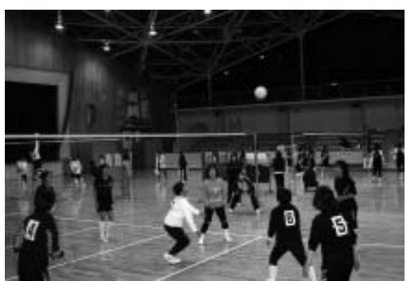
▲ふれあいスポーツ大会でのバレーボール

◎今年も 播磨町健康福祉フェア 〔4月29日(祝)大中古代の村〕で、スポーツクラブ21はりまの各種サークル団体が日ごろの活動を紹介します。イベント参加者が体験できるコーナーも設置します。ぜひ挑戦してみてください!! ◎平成16年度の多種目 ふれあいスポーツ大会 と 初心者教室 を年間を通じ計画しています。各種目別開催日時など募集要項はポスターまたは、チラシをご参照ください。