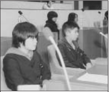
▲写っている方に写真または画像データを差しあげます。企画調整課まで。