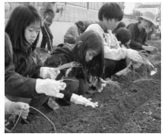
▲収穫のときが楽しみです!

玉ねぎ作りをすることはあまりなじみがないので、「玉ねぎの苗ってこんなに細いねんあ」と物珍しく植える人もいました。 春になり、おいしい玉ねぎをみんなで収穫できる日が今から待ち遠しいですね。