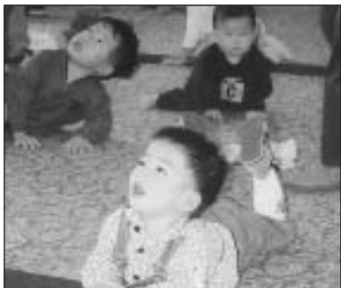
▲写っている方に写真または画像データを差しあげます。企画調整課まで。