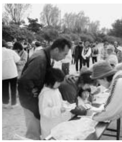
▲みんなで歩きましょう!

6月に続き、はりま健康プラン「とびつきり遊歩」グループでは、11月15日(土)に総合体育館から新島の先端まで