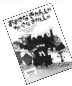
●おおきなきかんしゃ ちいさなきかんしゃ マーガレット・ワイズ・ブラウン文・アート・セイン絵