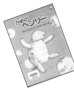
●かめのヘンリー ゆもと かずみ作・ほりかわ りまこ絵