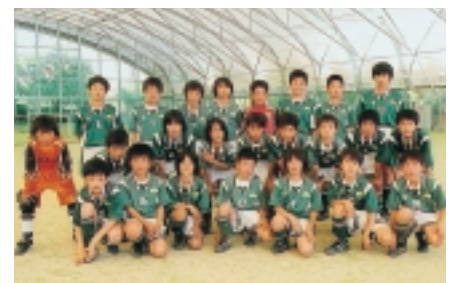
▲播磨サッカークラブ