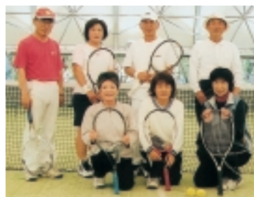
▲播磨町テニス協会