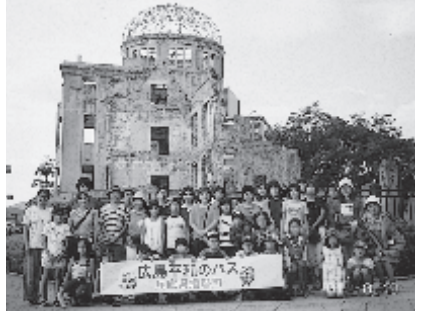
昨年参加されたみなさん