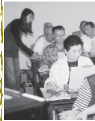
熱心な参加者たち

五月二十八日(火)から、パソコン技能講習会がスタートしました。南部コミセン・西部コミセン・中央公民館・蓮池小学校を会場に240人が受講します。