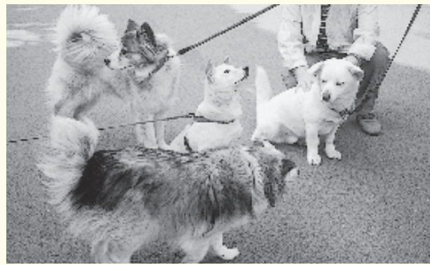
みんなと会って楽しそう

最近、動物虐待のニュースをよく耳にします。人間の身勝手な欲望で物言えぬ弱い立場の動物が残酷に殺されるのは、息苦しくさえ感じます。