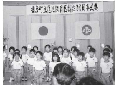
みんなで歌いました

五月二十五日(土)、蓮池保育園の創立三十周年式典が行われました。式典の中で、年長児がお祝いの歌を披露。「つまれた町ふるさと」は、播磨町そして、保育園が、子どもたちにとって大切なふるさとになるよつにという思いを込めて歌い、「ふるさと」の曲をハンドベルで演奏し、式に参加された来賓、保護者の方の大きな拍手を浴びました。