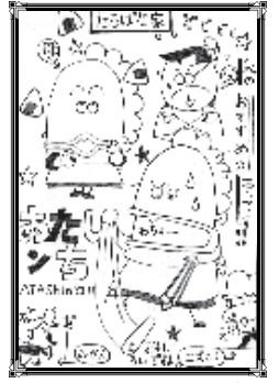
P.N. ひよこさん(野添城)