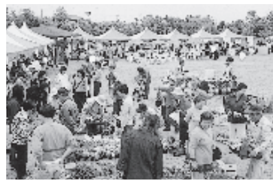
花や緑に囲まれた緑化イベント

も指導され、子どもたちに大人気でした。そして、野添北公園では、「緑化イベント」が開催され、訪れた人たちは種苗の販売や風船のプレゼント、緑の相談など緑にちなんだ催しを楽しみました。ほかに、「グリーンウォーキング」もあり、参加者たちは各コミセンから大中遺跡へウォーキングを楽しみ、さわやかな汗を流しました。