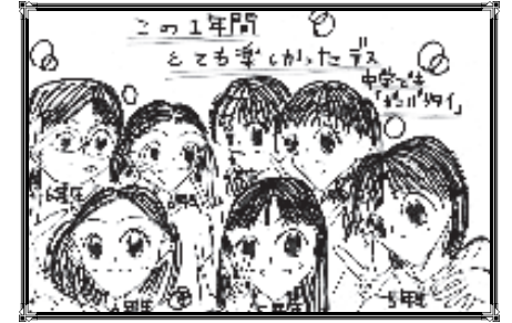
P.N. あきべーさん(北本荘)