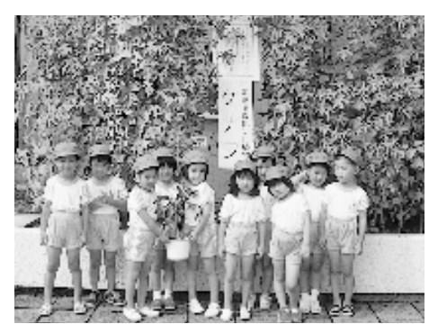
ケナフを植えよう！

環境問題の面から注目を集めているケナフ。中国やインドが原産のケナフは、1年草の植物で、二酸化炭素の吸収率が赤松の約5倍と優れ、木材パルプに替わって紙の原料にもなることから、森林保護、地球温暖化防止にも役立つ植物として、全国で栽培運動が進んでいます。挿し木をすれば、室内での観賞用植物にもなり、日差しが強い窓側に植えれば、日よけにもなります。10月にはハイビスカスにも似た、大きな白い花を咲かせます。 このケナフの種と育て方を希望者の方に、産業生活課で配布しています。 問い合わせ 産業生活課 ☎0794(35)2364