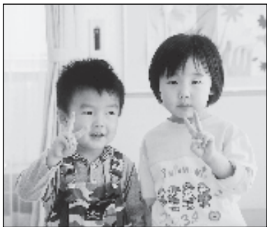
写っている方に写真または画像データを差しあげます。企画調整課まで。

役場・教育委員会 ☎0794-35-0355 F 35-3398 健康いきいきセンター ☎0794-35-5578 F 35-5227 福祉しあわせセンター ☎0794-35-1712 F 36-5610 デイサービスセンター ☎0794-37-6155 F 37-0065 加古川総合保健センター ☎0794-29-2923 F 29-6300 播磨ふれあいの家 ☎0796-78-1481 F 78-1482