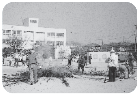
無病息災を願って

一月十三日、蓮池小学校の校庭に集合。あまり冷えの厳しくない、行事には、もってこいのお天気でした。ウォーキングは五キロコースと三キロコース、先導者についてかなりのハイペースで歩きました。汗をかきながら歩かないと効果がないそうです。汗をかくことは何にしても、気持ちの良いものです。コミセン単位で、こんな元気の出る催しがいっぱいあるといいですね。校庭到着後、ぜんざいをいただきました。その後、