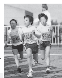
スタート直後(下)と一生懸命な選手たち(右)

総合体育館前をスタートし、新島内各コースを駆け巡る「第24回播磨町ロードレース大会」が一月二十七日(日)、盛大に行われ、年齢・男女別に設けられた一・五キロから十キロまでの部、ファミリーの部の計十五種目に、招待選手を含む約八百人が参加。開会式の後、ランナーたちは体育館前を勢いよく出発、沿道の家族や友達の声援を背に力走していった。各レースの優勝者は次の通り。(敬称略)