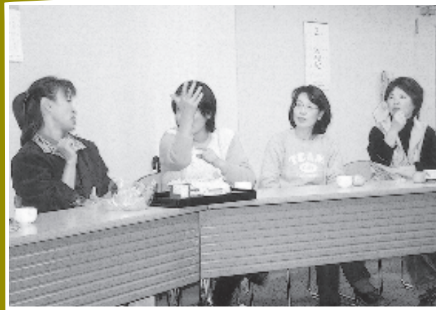
手話サークルはりまの交流会

永年にわたりボランティア活動を続けてこられた個人や、団体に対して贈られる「ひょうご県民ボランティア活動賞」を手話サークルはりまが受賞しました。手話サークルはりまは、さまざまなイベント時に聴覚障害者へのコミュニケーションを行ったり、年数回開かれる学校での福祉学習に聴覚障害者と共に参加して、聴覚障害者に対する啓発活動を行っています。また、平素の学習会では各種団体と連携を取りながら、少しでも聴覚障害者に理解してもらいやすい手話通訳を目指して、日々努力されています。