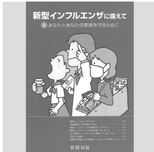
▲新型インフルエンザのパンフ作成を

新型インフルエンザの町独自のマニュアルの事前整備がなければ、感染拡大時に起こる諸問題に迅速かつ的確に対応し、町民の安全・安心を確保することはできないと思う。 ① 「新型インフルエンザ対応に関する基本指針」の整備はいつか。 ② 「危機管理に関する要綱」の整備は。 ③ 職員の「業務継続計画」の作成は。 ④ 3月定例会で質問した、旧北小学校の汚水垂れ流しは、県からのような説明があったのか。 答弁Ⅱ柘田理事 ① 国は本年2月に「行動計画」「ガイドライン」を改正し、県も本年4月に「対策計画」を策定している。本町も国、県と一貫性のある「対策計画」を、本年度中に策定したい。 ② 「危機管理に関する要綱」は整備していない。 ③ 事前整備が整っていないので早急に策定を行い、普及・教育・訓練に取り組む。 ④ 2月27日午後試験的に植木に散水し、3月1日で行った。汚泥は側溝には流していないと、4月1日に特別支援学校長が報告にこられた。