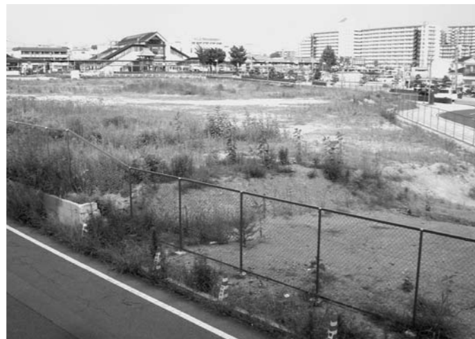
▲有効利用が期待される（病院建設予定地）

国の医師配置システムがないと、地方の医師確保は難しいとのこと。はりま病院の誘致をうたわれている町長の見解は、 ① 医師の確保は大丈夫か。 ② 倒産などリスク対策は。 ③ 住民への環境保全は。 ④ 医師不足で救急指定返上の危険性はないのか。