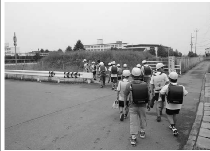
▲安全安心のまちで、子どもの健やかな成長を

新聞などの滞留で気づいた配達員や近隣の人による連絡で調査に行く場合もある。民生委員以外にも民間事業者の協力が得られれば、よりきめ細やかな見守り活動が出来る。その他の質問 Q 望海公園の管理と整備の見直しは。 A 海岸線清掃は、引き続き県へ要望する。