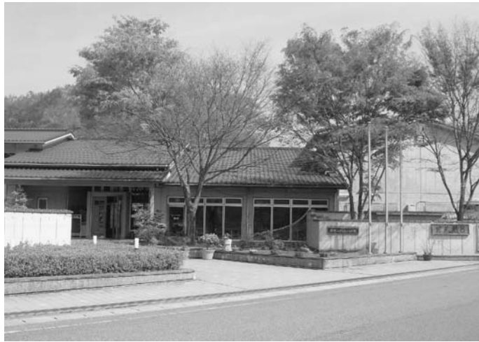
▲指定管理者に運営されている「播磨ふれあいの家」