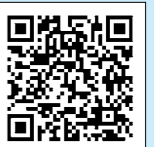
調整給付金 (播磨町 HP)

令和 6 年度住民税所得割額を上回る方に合計額を基礎として、1 万円単位を切り上げて給付します。また、令和 6 年度に