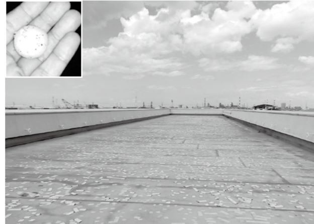
屋上の防水シートが大きく破損

4 月 16 日夜に発生した降雹により、町道播磨町駅地下道の上屋防水シートが破損し、雨漏りが生じています。また、播磨幼稚園、蓮池小学校、播磨西小学校、播磨中学校の校舎屋上防水シートが破損したため、改修工事を実施する補正予算を可決しました。